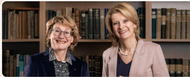
Die Präsidentinnen der Landesgeschäftsstelle Steiermark

Die steirische Apothekerkammer lädt Sie herzlich ein, an unserer Aktion rund um Frauengesundheit teilzunehmen.